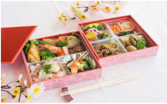
①郷土料理弁当 写真