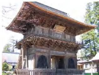
② : 長勝寺