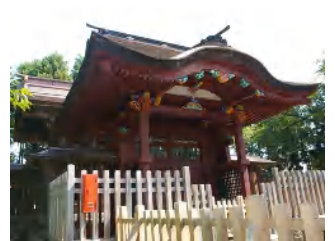
④ : 弘前八幡宮