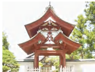
③ : 誓願寺