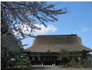
① : 革秀寺

52 庭に弘前市の天然記念物に指定されている2代藩主・信枚 のぶひら お手植えの伝承を持つサルスベリが残っている寺社は どれでしょう。