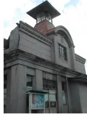
P87 (7)紺屋町界隈～火の見櫓