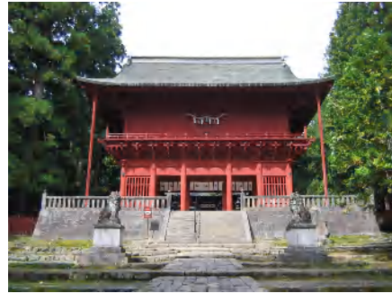
P91 ◎岩木山神社 楼門の写真