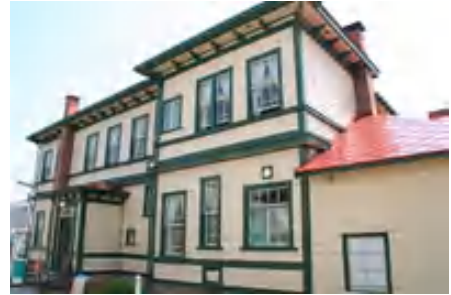
P96 (6)旧・東奥義塾外人教師館の写真