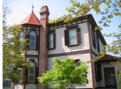
P95 (2)弘前学院外人宣教師館の写真