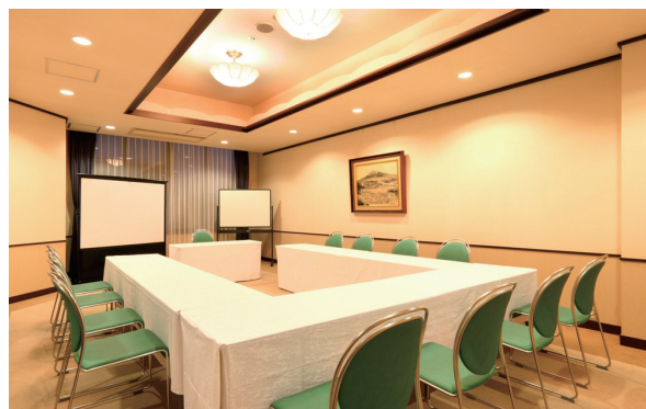
▲個室会場ごたつの間 Meeting room Godagu-no-ma