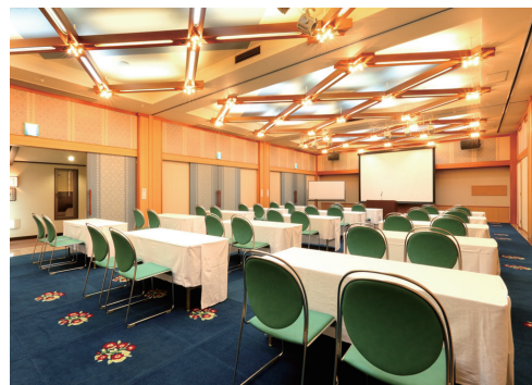
▲コンベンションホール Convention hall