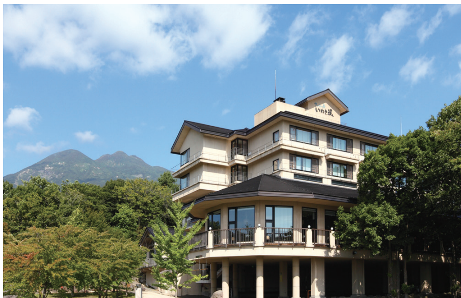
▲アソベの森いわき荘外観

It is believed that Mt. Iwaki is the place where a Kami dwells. Asobe-no-mori Iwakisou is located near the Mt. Iwaki, you can use this facility can be used for conferences, parties, and weddings. We have dealt with various kinds of events.