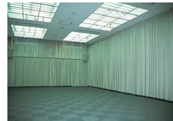
▲多目的ホール Multi-purpose Hall

Hirosaki Municipal Tourist Center gives tourist information of Hirosaki.