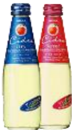
ニッカシードル Nikka cider