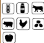
りんごカレー apple curry