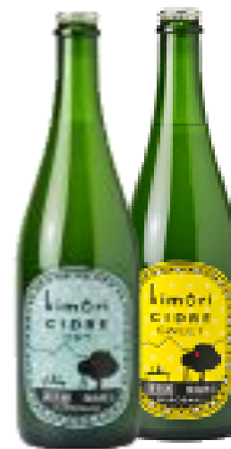
キモリシードル Kimori cider