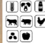
りんごカツカレー cutlet curry