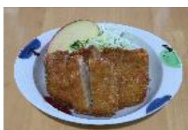
りんごカツ apple cutlet