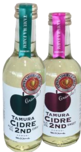
タムラ 2ND Tamura cider