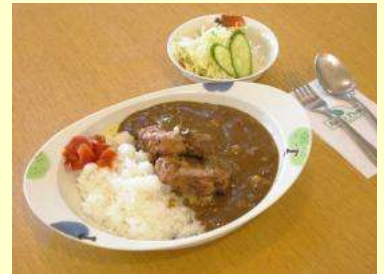
いがめんちカレー ミニサラダ付 990円

りんご公園オリジナルの特製いがめんちを、りんごカレーの上にトッピングした、りんご公園でしか味わえないオリジナルメニューです。