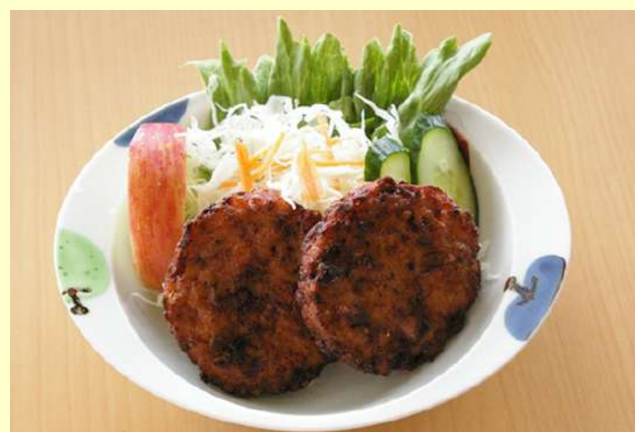
いがめんち 580円 イカのゲソや身・野菜を刻んで、バターで炒めたりんごを、溶いた小麦粉を混ぜて揚げたりんご公園特製のいがめんち