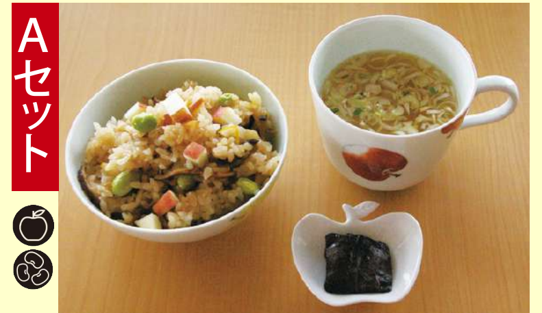
りんごご飯・しそ巻りんご・みそ汁 462円