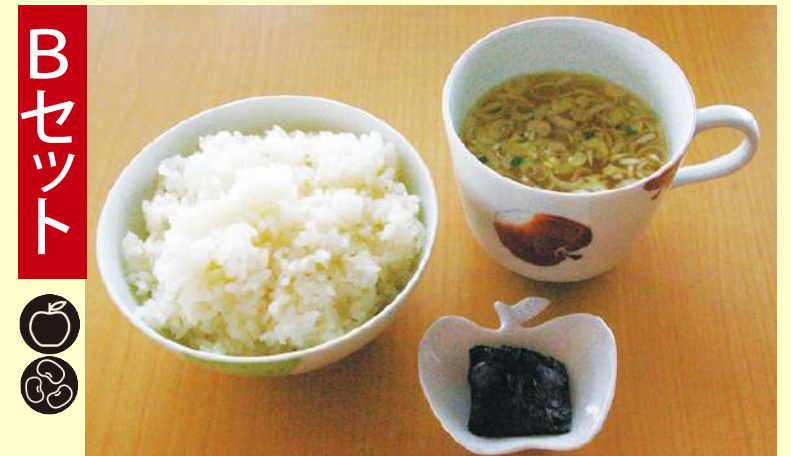
ご飯・しそ巻りんご・みそ汁 352円