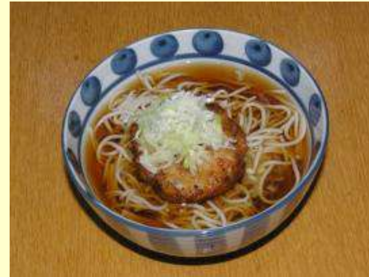
いがめんちそば・うどん (温・冷)