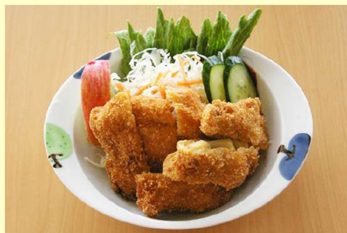
りんごカツ 580円 やわらかい豚肉でりんごを挟んだロースカツにサラダが付いたボリューム満点のりんご公園イチオシ料理