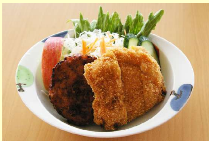
りんごカツ&いがめんち 580円 りんごカツといがめんちの合盛り。どちらも味わってみたい方におすすめです。