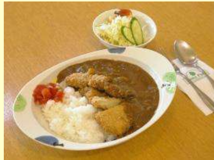
りんごカツカレー ミニサラダ付 990円

やわらかい豚肉でりんごを挟んだロースカツをりんご公園オリジナルカレーの上に乗せたボリューム満点の一品です。