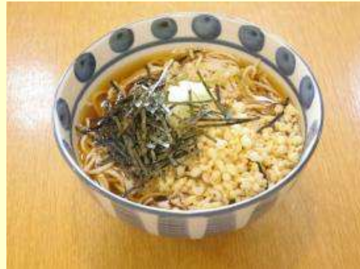
たぬきそば・うどん (温・冷)