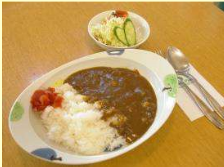
りんごカレー ミニサラダ付 750円

じっくりと煮込まれた野菜の美味しさをりんご果汁、バターで炒めたりんごを加えたまろやかなコクと甘さが特徴のりんご公園オリジナルカレーです。