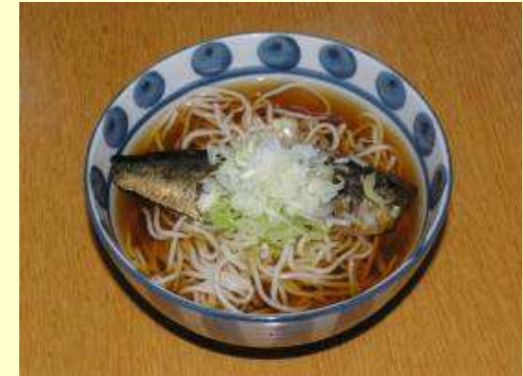
にしんそば・うどん (温・冷)