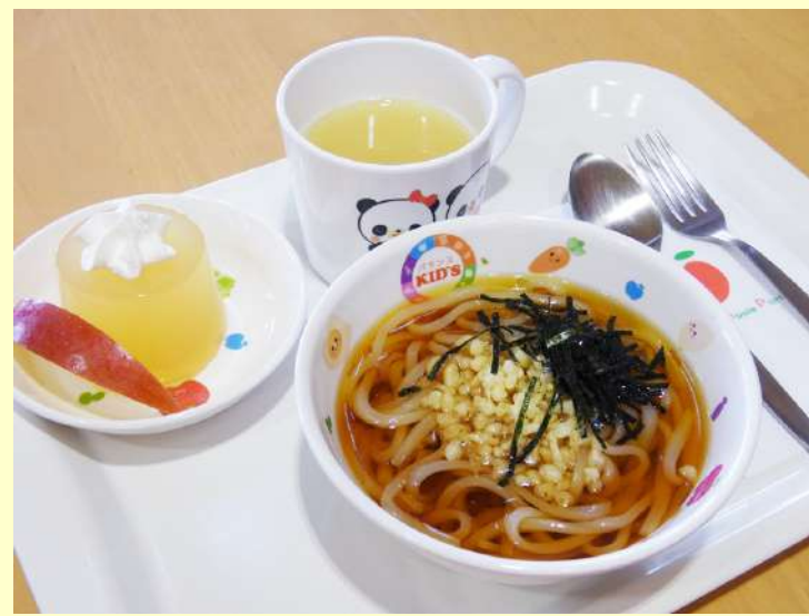
お子様うどん (温・冷) ゼリー ジュース付