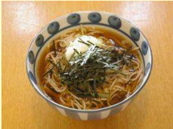
山菜そば・うどん (温・冷)