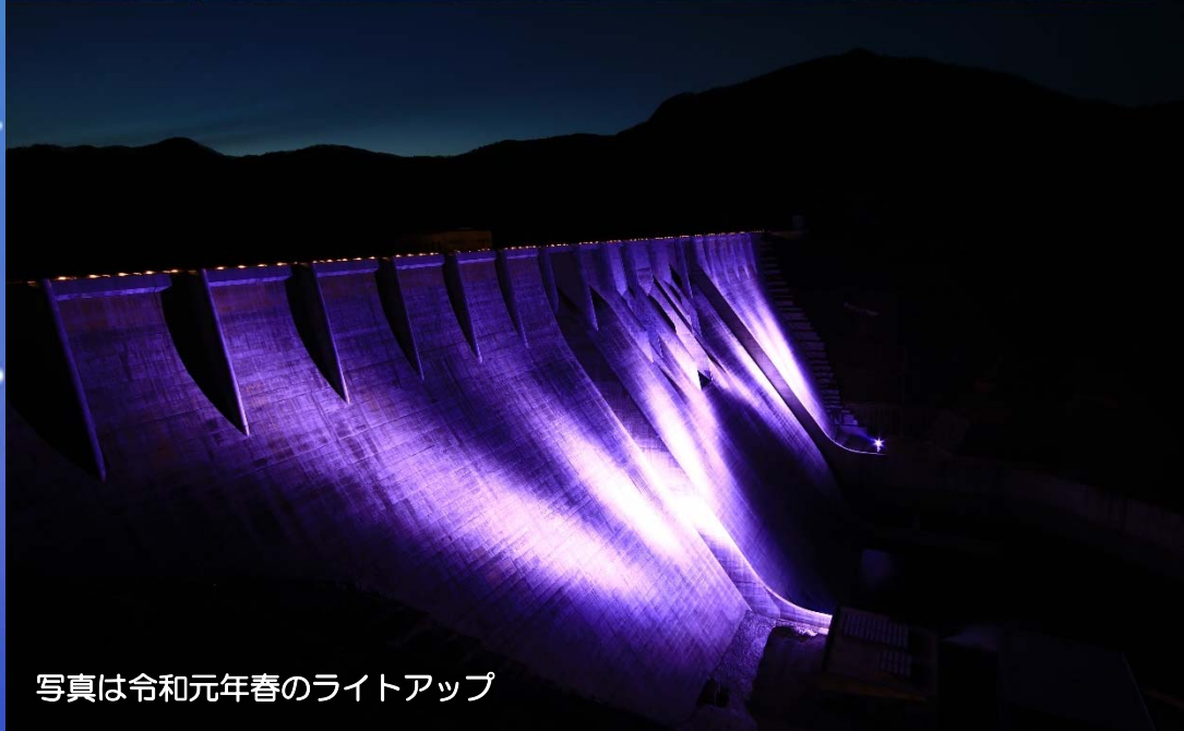
写真は令和元年春のライトアップ

※ライトアップ終了後、ゲートを閉めますので速やかにお帰りください。 ※災害等が発生するおそれがある場合等、ライトアップを中止する場合があります。