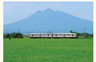
柏農高校前付近の風景