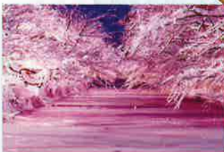
冬に咲くさくらライトアップ