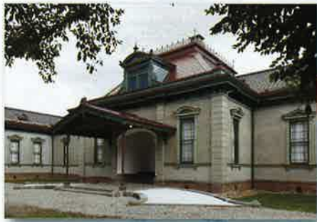
大雪像 旧弘前藩社

北の郭エリアにおいていただいた方にキャンドルをお渡します。それを思い思いの場所にどうぞ。皆様がおいたキャンドルたちが、明りの溢れる空間を創り出します。 【期間中 17:00~21:00】