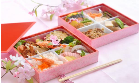
お弁当写真(イメージ)