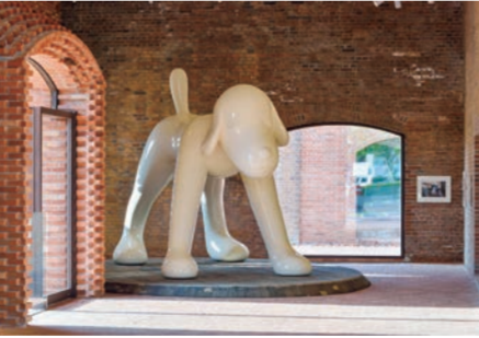
나미 오시노. A to Z Memorial Dog, 2007 ©Yoshitomo Nara

히로사키시 요시노초 2-1 0172-32-8950 09:00~17:00 화요일(화요일이 공휴일일 경우 다음날), 연말연시 휴무