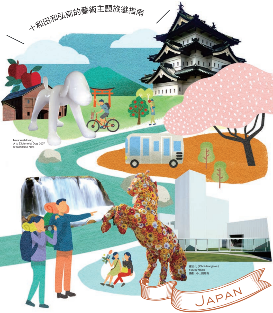
弘前市 / 十和田市