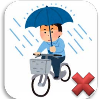
傘さし運転禁止 禁止一边撑伞一边骑自行车