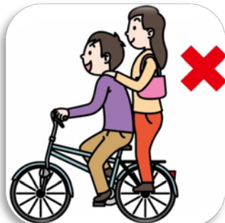
二人乗り禁止 禁止骑自行车带人