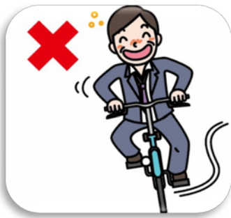
酒気帯び運転等の禁止 禁止酒后骑自行车