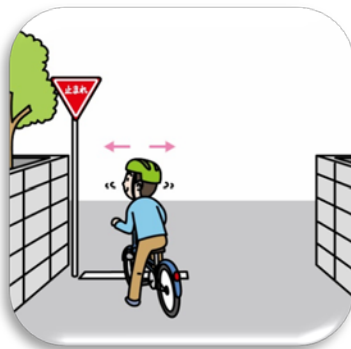
交差点での一時停止・安全確認 在路口须停下并确认周边安全情况