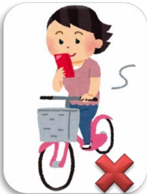
携帯電話使用運転禁止 禁止一边使用手机一边骑自行车