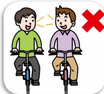
並進の禁止 禁止多辆自行车并排通行