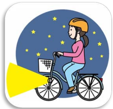
夜間はライトを点灯 夜间骑自行车须开车灯