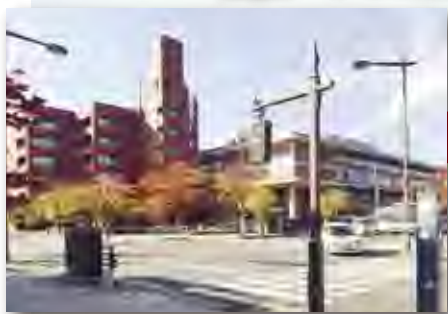
大雪像 市役所 前川新館・本館

北の郭エリアにおいていただいた方にキャンドルをお渡します。それを思い思いの場所にどうぞ。皆様がおいたキャンドルたちが、明りの溢れる空間を創り出します。 【期間中 17:00~21:00】