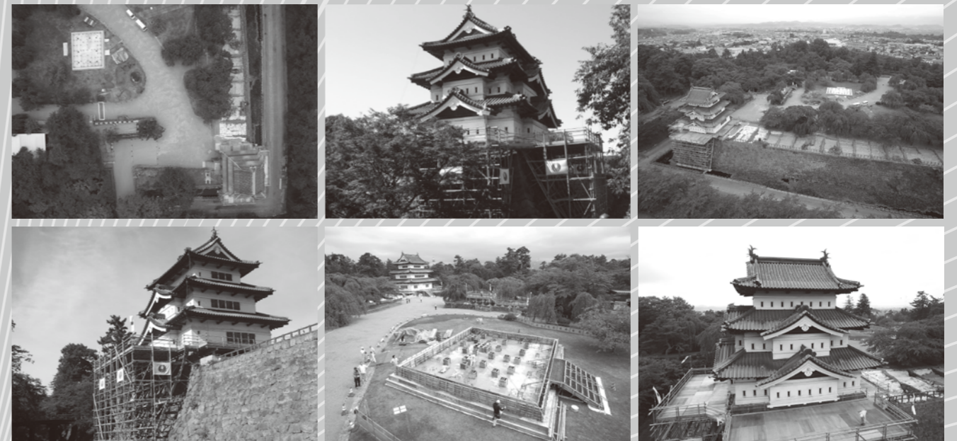
平成27年度夏 天守曳屋前の弘前城の様子