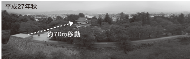
天守曳屋工事想定図/天守は本丸中央部へ約70m移動します。曳屋工事中も本丸へは入場できます。