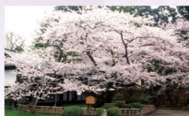
日本最古のソメイヨシノ