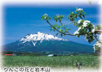
りんごの花と岩木山