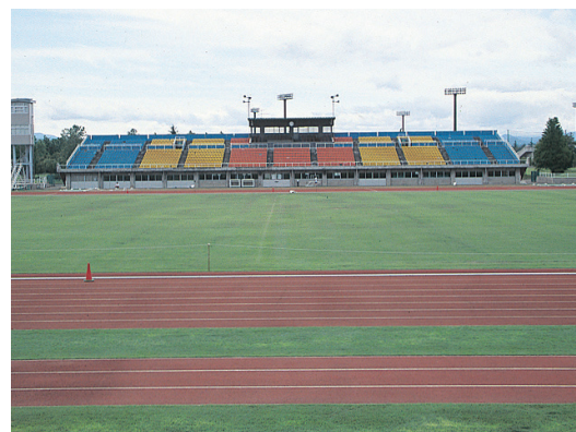
▲陸上競技場 Athletic stadium

Dec 29th ~ Jan 3rd (During the winter season is closed)