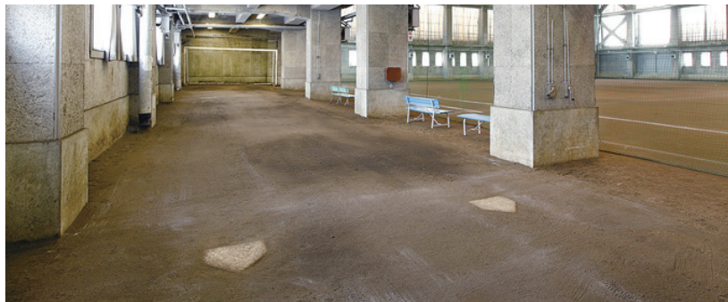
▲主練習場 Main Practice Field