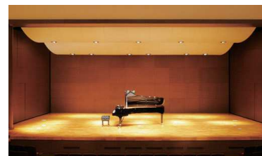
▲みちのくホール Michinoku Hall

Saturday. Sunday. Public Holidays. Dec.28th~Jan.4th