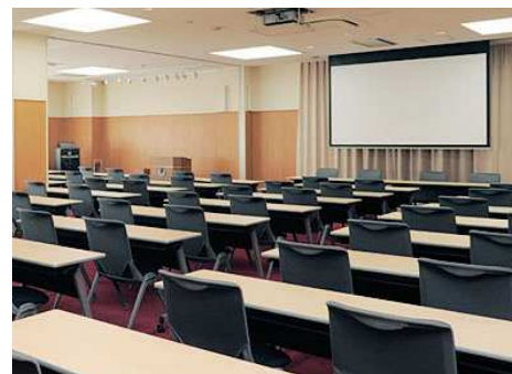
▲岩木ホール Iwaki Hall