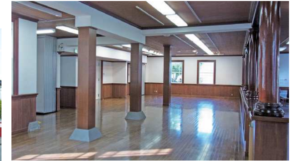
▲第1展示室 First Exhibition Room